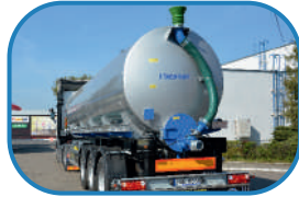
Верхня наливна система