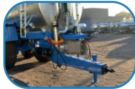
Насос для густої рідини