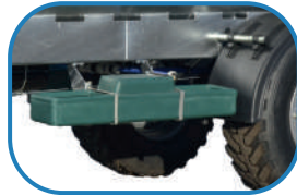
Поїлки для тварин

Широкий асортимент додаткового обладнання надає можливість пристосовувати асенізаційні машини та цистерни до індивідуальних потреб замовника.