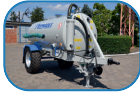
Верхній транспортний зачіп