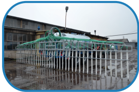
Пригрунтові дозатори зі шлангами