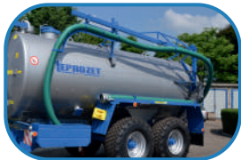
Обертальне плече зі шлангом