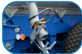
Швидке з'єднання зі шлангом