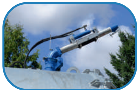
Обертальний лафетний ствол