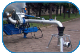
Відкидна всмоктувальна труба